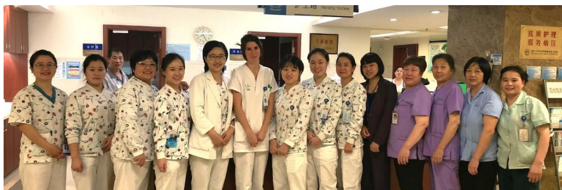
Mission d'observation en chirurgie orthopédique à Hangzhou - 2018