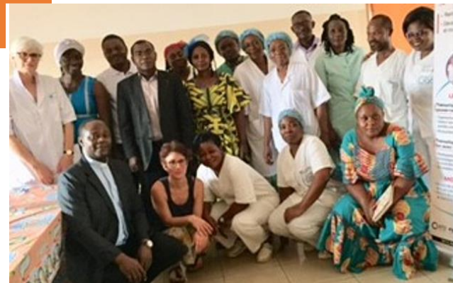
Restitution- échanges avec le groupe Direction et Encadrement du CASS