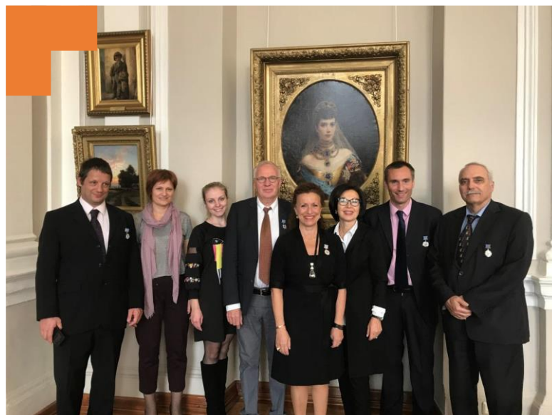
Réception au Musée de la ville, à l'occasion des 100 ans de l'Université médicale d'Etat d'Irkoutsk.