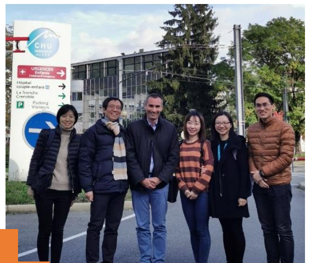
Accueil de médecins et soignants en stage d'observation